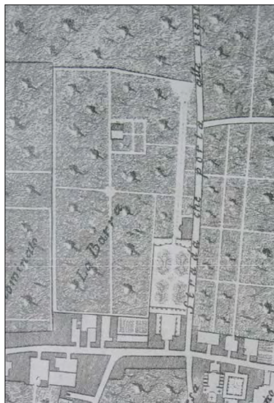
Fig. 4 - Il Casale della Barra nella Pianta del Duca di Noja (da: COLLETTA 1974)