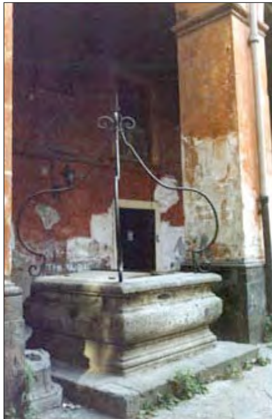
Fig. 7 - Un pozzo oggi ancora presente nel Palazzo di Villa Bisignano

Petagna lo informa di aver individuato il nuovo genere botanico e di averlo dedicato a Pietro Antonio Sanseverino, chiedendogli peraltro conferma della effettiva novità da esso rappresentata.