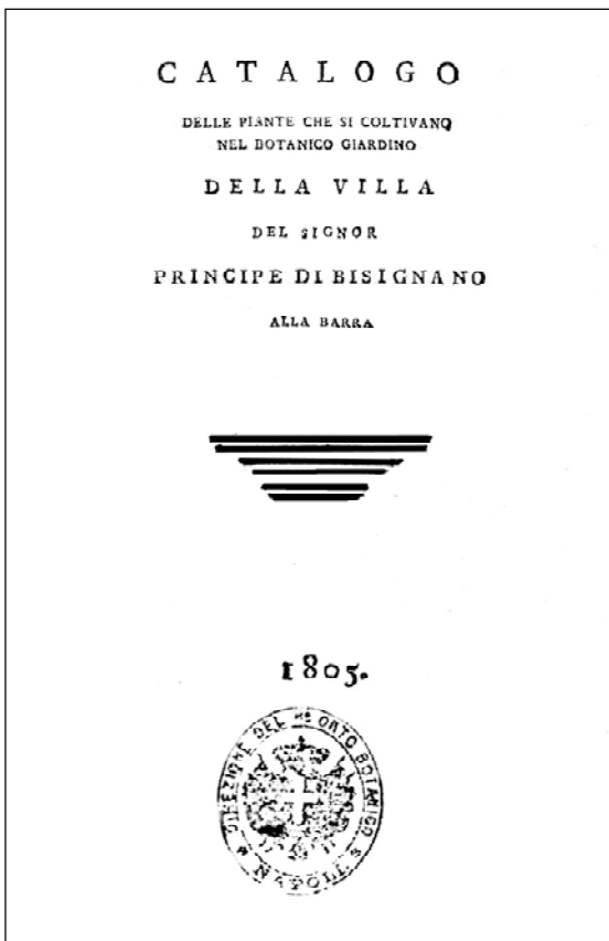
Fig. 6 - Frontespizio del Catalogo delle piante del Giardino (TENORE 1805)