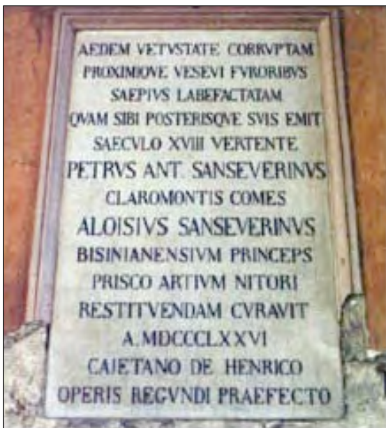
Fig. 1 - Lapide collocata nell'atrio del palazzo da Luigi Sanseverino