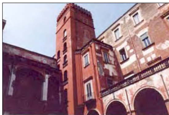
Fig. 2 - La Torre Belvedere oggi

Alle spalle del palazzo si apriva un ampio giardino rettangolare sviluppato in lunghezza. Questo giardino di rappresentanza era recintato tutt'intorno da un muro ed era diviso in quattro comparti da due viali perpendicolari la cui intersezione centrale ospitava una grande fontana in piperno, così come di piperno erano i muretti che cingevano le quattro aiuole di cui